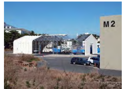
J-PARC 南地区で、テントハウスの設置工事が進む。