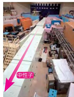
MLF/BLO9 (第1実験ホール側の様子)