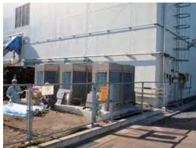
ニュートリノ実験施設(TS)では、パッケージエアコン室外機を設置。