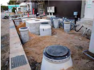
リニアック棟玄関脇では、ユーティリティ設備の復旧工事が進む。

来年1月中旬の MLF 共用運転やハドロン及びニュートリノ実験施設の利用運転に向け、機器調整や遮蔽体の積み戻し工事などが進んでいる。MLF では、ビームラインの新設工事などを継続実施中。また、リニアック棟など建屋周辺の復旧工事も継続して実施している。