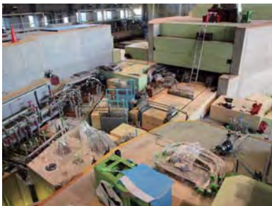
ハドロン実験施設陽子ビームラインでは、機器設置と遮蔽体の積み戻しなどが進む。