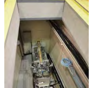
MLF 第2実験ホールに「試料垂直型偏極中性子反射率計」BL17を建設中。