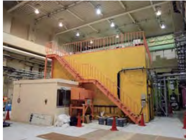
MLF 西側増設建屋では、BL19「匠」装置本体室などの再設置作業が進む。