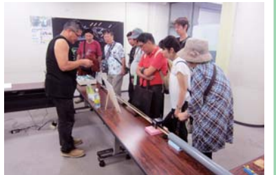
今回初披露した「カウス加速器」

J-PARC で進む T2K 実験は、東海村にある J-PARC の加速器で人工的に作ったニュートリノを、岐阜県飛騨市神岡町にある東京大学宇宙線研究所のスーパーカミオカンデ(SK)に送り出し、飛行中の変化を観測しています。毎年夏、SK のある神岡町では、地下 1,000m の神岡鉱山内の SK 実験エリアなどの見学がメインの探検イベント「GSA (ジオ・スペース・アドベンチャー)」が開催されており、J-PARC センターも今年初めてこのイベントに出展しました。イベントでは、広報セクションのスタッフが、J-PARC の概要と人工的なニュートリノの発生について紹介し、さらに、加速器の原理について学習する磁石をテーマとした科学実験を行いました。8 月には飛騨市が J-PARC の施設公開を訪れるツアーを企画し、飛騨市の方々が見学する予定です。