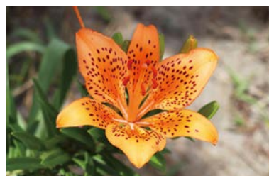
花びらの根本に隙間があり、後ろが透けて見えるのが名前の由来