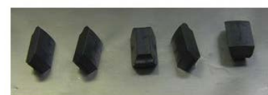
上: J-PARCで現在使用している回転標的 下: 上図のボール間に挿入した二硫化タングステンの塊