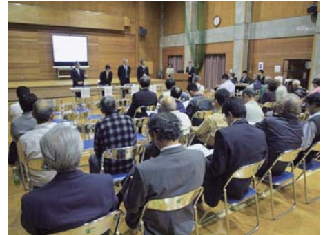
真崎コミュニティセンターでの様子 (11月1日)

ハドロン実験施設の事故を踏まえ、再発防止などの取組に関する住民説明会を、東海村で3回開催しました。延べ85名の方にご参加いただきました。J-PARCセンターより改めて事故についてお詫び申し上げ、事故後のJ-PARCセンターが取り組んできました再発防止策、安全管理の強化策、金標的の調査について報告致しました。皆様からの多くのご質問にお答えするとともに、貴重なご意見を伺いました。