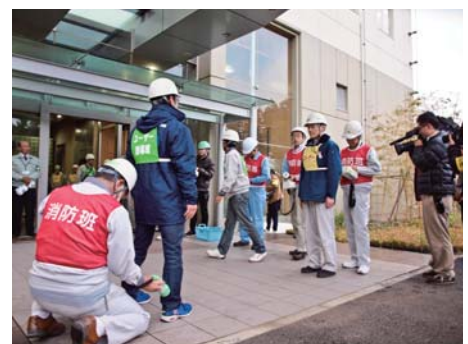
避難したユーザーの放射能汚染検査訓練 (MLF 玄関前)

J-PARCセンターは事故再発防止対策として、異常の兆候を見逃さないよう、従来の「基本体制」と「非常体制」の間に「注意体制」を新設しました。今回の訓練は、物質・生命科学実験施設(MLF)で水銀漏えいを感知するモニターが異常信号を出したという想定で実施されました。注意体制を設定、現場での状況確認、判断により事故体制に移行する、新しい緊急時の手順に従って訓練が進み、MLFの制御室に事故現場指揮所、原子力科学研究所の安全管理棟に事故対策本部を設置しました。この訓練には、茨城県や周辺自治体関係者のご視察に来られ、プレスによる取材も行われました。