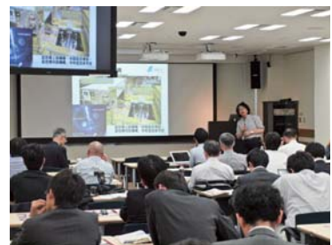
iMATERIAについて装置責任者が報告

MLF中性子ビームラインBL20の茨城県材料構造解析装置「iMATERIA」では、高温雰囲気やガス雰囲気などの諸条件下における磁石材料のその場構造解析研究が計画されており、茨城県プロジェクト研究と元素戦略プロジェクト拠点は、その基礎研究を進めている。今回、これら研究を推進するため東京で分科会を開催し、iMATERIAの性能、磁気構造解析の基礎知識、粉末磁気構造解析プログラムの利用例などについての報告と、活発な質疑応答が行われた。