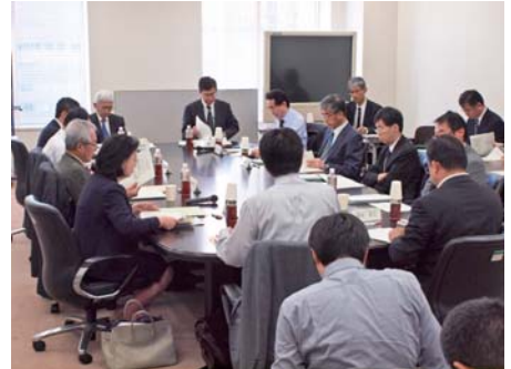
第5回会合の様子(10月30日)

標記部会では、本年8月より高レベル放射性廃棄物に含まれる長寿命放射性核種の群分離・核変換技術研究の研究開発の妥当性や今後の進め方などについての評価、検討を進めてきた。10月23日に開催された第4回会合では、J-PARCに建設予定の核変換実験施設の整備を含めた今後の研究開発のロードマップ等が審議され、同月30日の第5回会合では、中間的な論点のとりまとめ案が審議された。核変換実験施設については、次のステージに移行していくことが適当とされており、施設の整備に向けた方向性が示された。