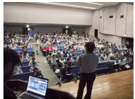
教育訓練の会場の様子