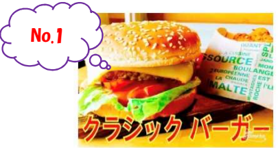
クラシックバーガー 800Yen CLASSIC BURGER