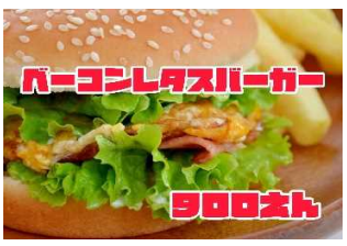
ベーコンレタスバーガー 900Yen BACON & LETTUCE BURGER

これこそ王道のジャンクフード ベーコンの旨味とバーガーのボ リューミーを楽しめるバーガー です。