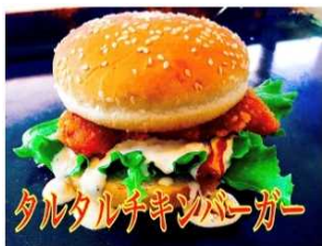
タルタルチキンバーガー

タルタルチキンバーガー 700Yen CHICKEN & TARTAR-SAUCE