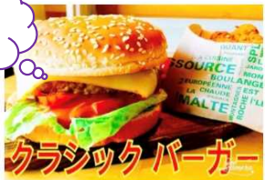
クラシックバーガー