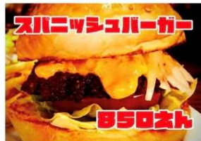
スパニッシュバーガー