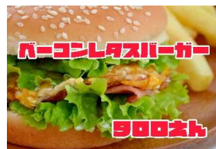
ベーコンレタスバーガー