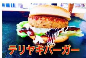
テリヤキバーガー