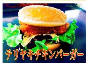
テリヤキチキンバーガー

老若男女問わず大好きな永遠の味 オリジナルのテリヤキが 130gのパティとの相性抜群です。