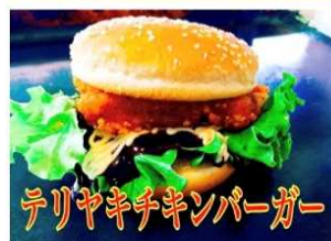
テリヤキチキンバーガー

老若男女問わず大好きな永遠の味 オリジナルのテリヤキが 130gのパティとの相性抜群です。