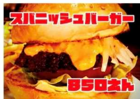
スパニッシュバーガー