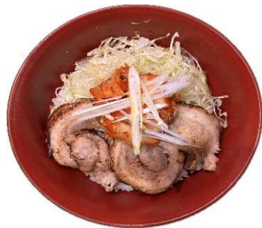
キムチのせ炙りチャーシュー丼 850Yen Seared Pork Donburi with Kimchi on top