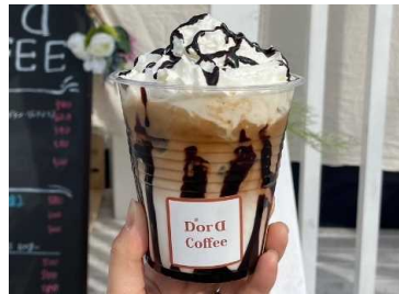
カフェモカ 600Yen (ホイップ付は650Yen) Latte & chocolate チョコレートとラテの贅沢ドリンク