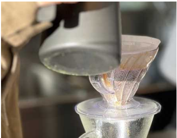
自家焙煎珈琲 450Yen Coffee 3か国の豆の最高峰ブレンド