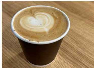
カフェラテ 450Yen latte ココ&苦いの王道ラテ