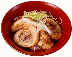
炙りチャーシュー丼 800Yen Seared Pork Donburi