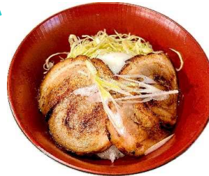
温玉のせ炙りチャーシュー丼 900Yen Seared Pork Donburi with Egg on top