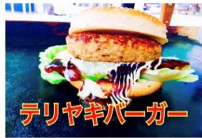
テリヤキバーガー