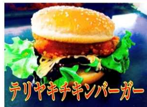
テリヤキチキンバーガー

老若男女問わず大好きな永遠の味 オリジナルのテリヤキが 130gのパティとの相性抜群です。