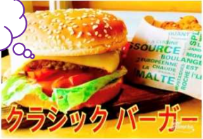
クラシックバーガー