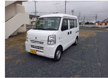
軽自動車（4人乗り） スズキ エブリイ

東海キャンパス西地区（いばらき量子ビーム研究センター（IQBRC）、東海ドミトリ、東海1号館）⇔J-PARC間の移動手段はこれまで貸出自転車で対応していましたが雨天時、夜間及び特に雪や凍結の際の自転車運転は危険を伴うため移動手段の改善要望が出ておりました。移動手段の1つとしてJ-PARCユーザーズオフィスに配備している共用車1台を無償で貸出することにしました。